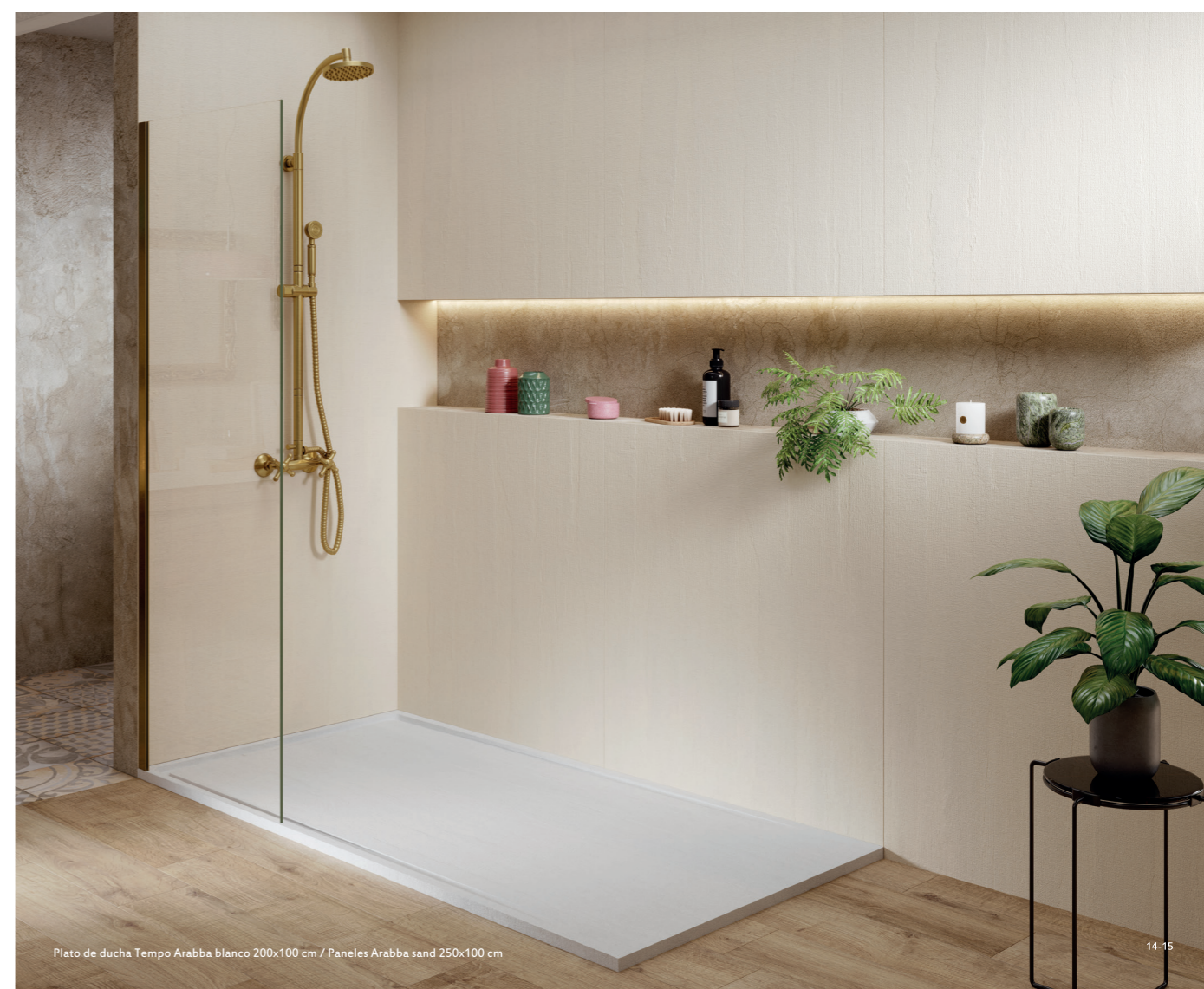
Plato de ducha Tempo Arabba blanco 200x100 cm / Paneles Arabba sand 250x100 cm