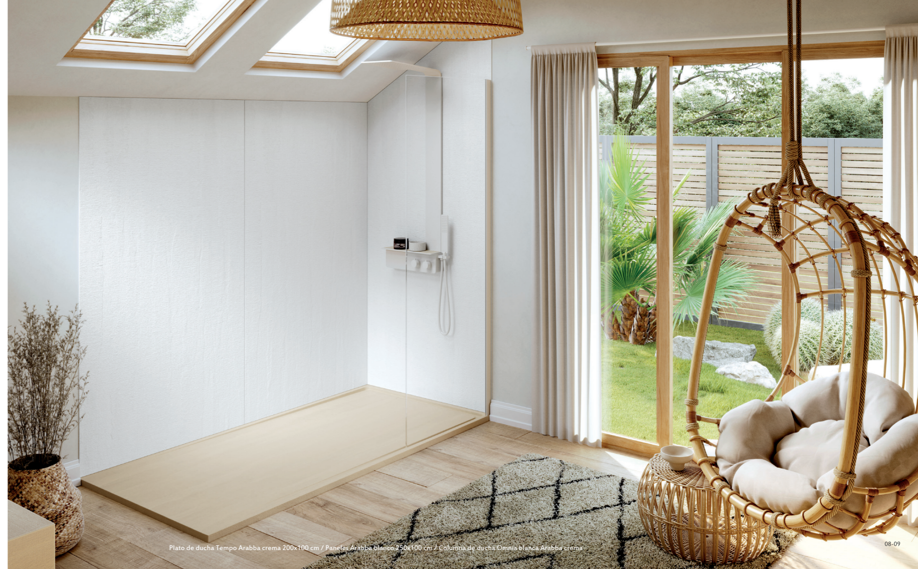
Plato de ducha Tempo Arabba crema 200x100 cm / Paneles Arabba blanco 250x100 cm / Columna de ducha Omnia blanca Arabba crema