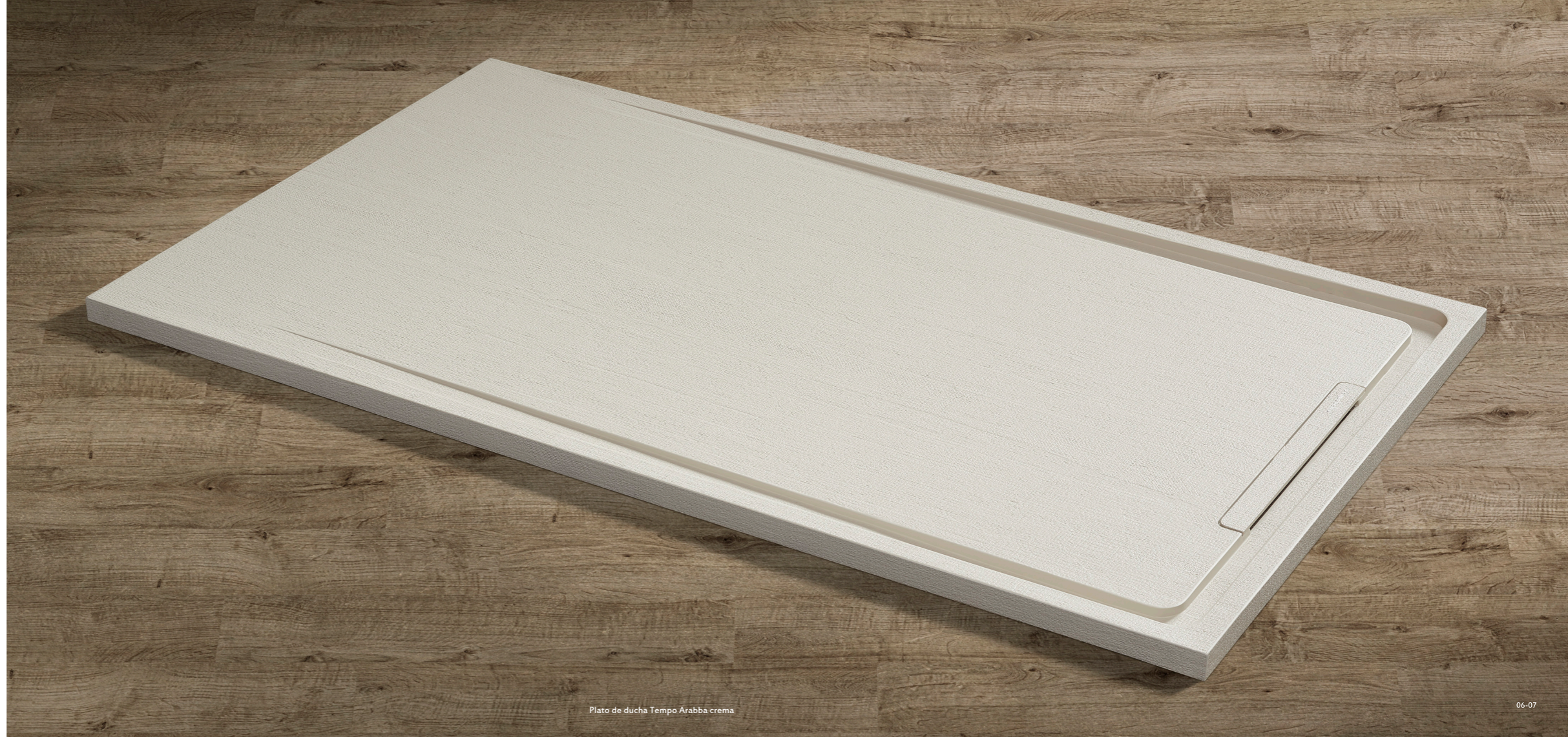
Plato de ducha Tempo Arabba crema