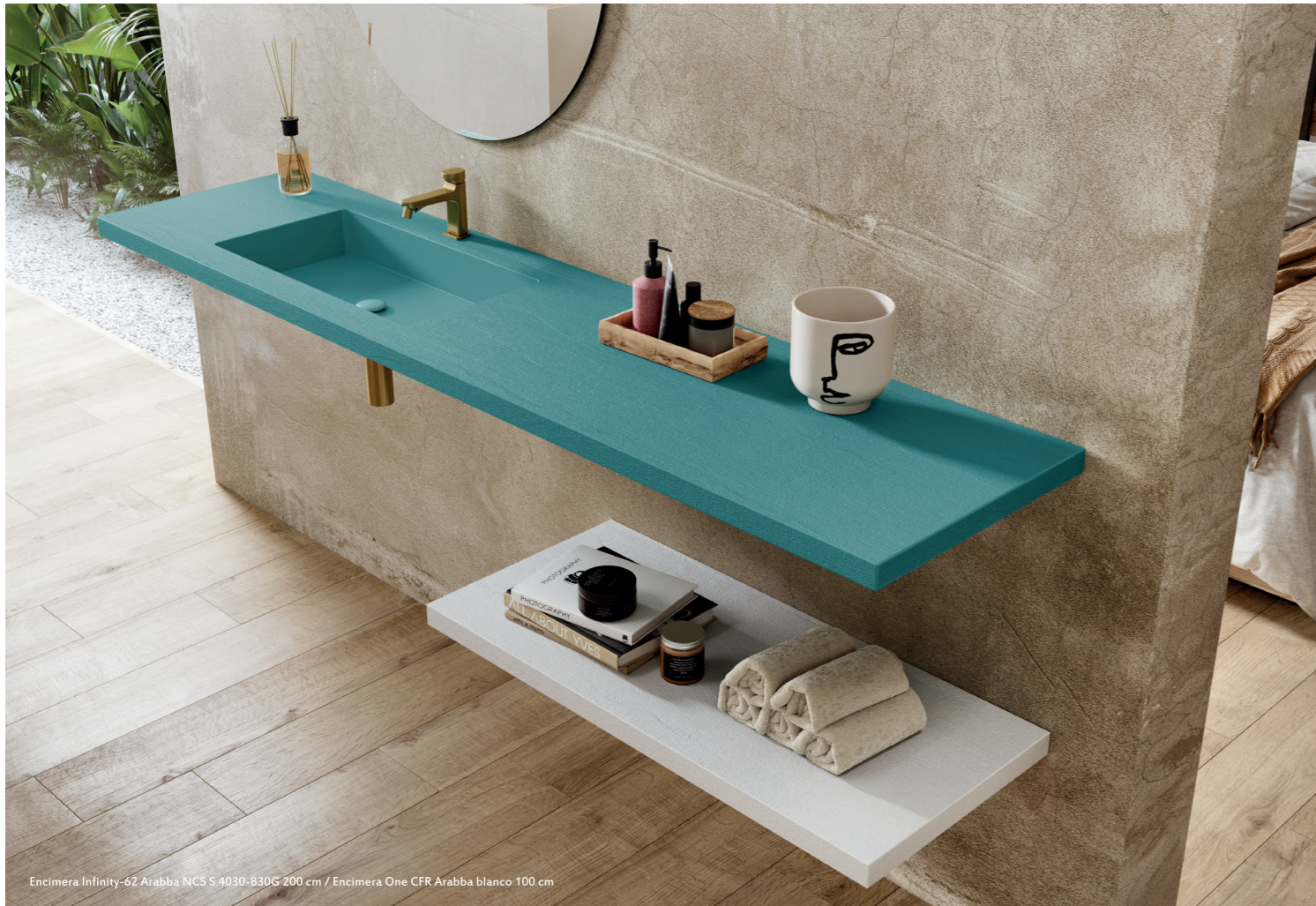
Encimera Infinity-62 Arabba NCS S 4030-B30G 200 cm / Encimera One CFR Arabba blanco 100 cm