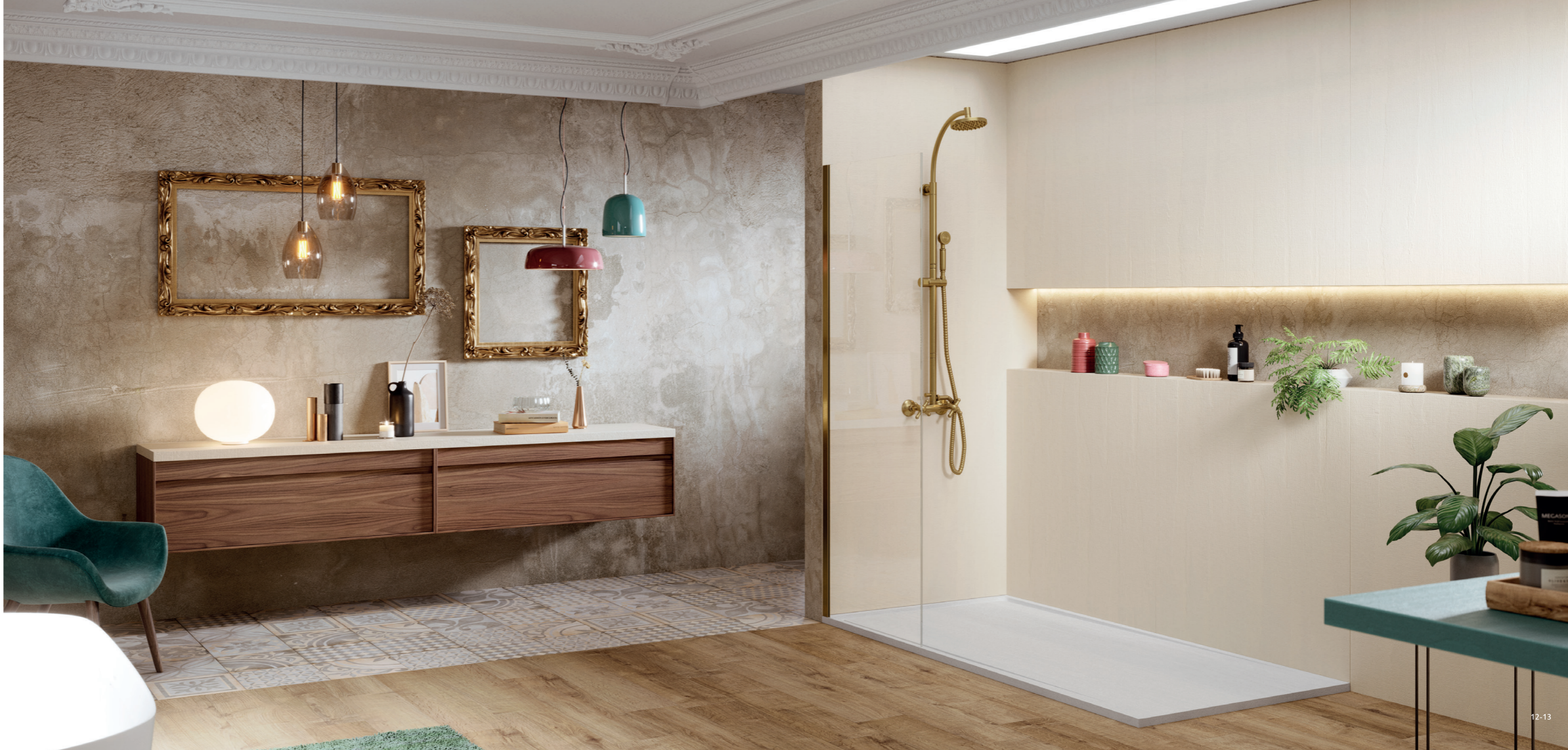
Plato de ducha Tempo Arabba blanco 200x100 cm / Paneles Arabba sand 250x100 cm / Encimera One CFR Arabba sand 240 cm / Muebles Box madera 120