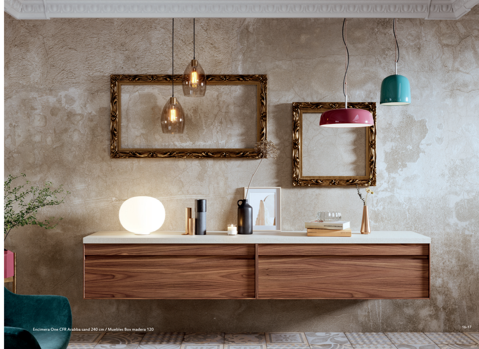
Encimera One CFR Arabba sand 240 cm / Muebles Box madera 120